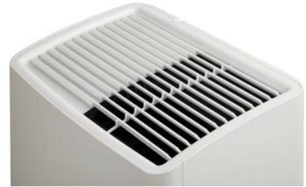
Puhdasta ilmaa – suoraan ulkoilmasta